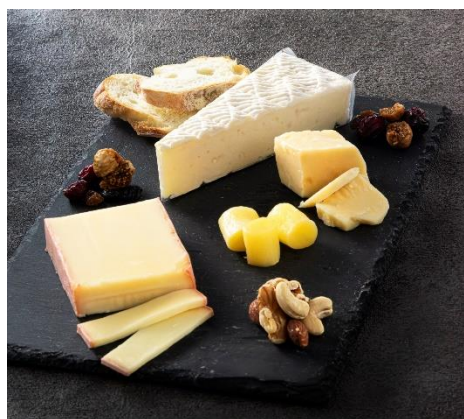
チーズ4種盛り合わせ (イメージ)