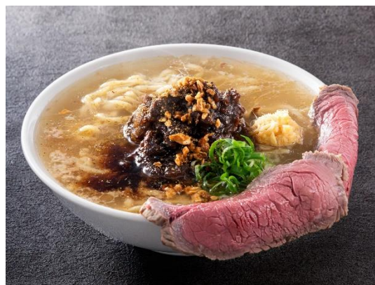
トヨニシファームの牛骨ラーメン プレーン (イメージ)