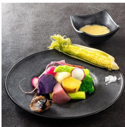
北海道産じゃがいも三種と夏芽アスパラに ラクレットチーズを添えて (イメージ)