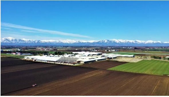
トヨニシファーム空中写真