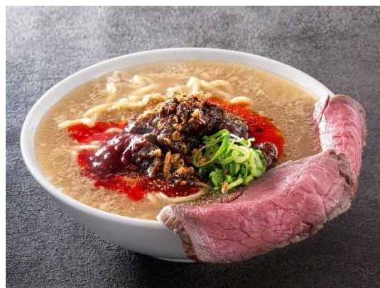
トヨニシファームの牛骨ラーメン 辛 (イメージ)