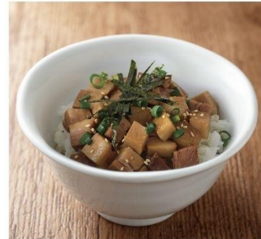
チャーシューまぶしごはん