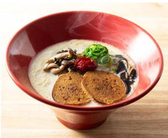
【店舗限定】プラント赤丸

「プラント赤丸」は、動物性食材を使用せずに一風堂の看板ラーメン「赤丸新味」のような味わいを表現したプラントベースのラーメンです。スープは、コク深い豆乳ベースのスープに昆布だしの旨味を加え、まるでとんこつスープのようなまろやかな味わいに。麺は、一般的につなぎとして使用される卵を使わずに、博多らしい細麺に仕上げました。トッピングの主役は、しっかりとした歯ごたえとボリューム感のあるベジチャーシュー。さらに、香りと食感のアクセントにオリーブオイルで炒めた3種のきのこをトッピングします。ガーリックが効いた香油と特製の辛みそを少しずつスープに溶かしていくのがおすすめの食べ方です。国内では「浅草雷門通り店」の他にも「銀座店」「銀座東店」「原宿竹下通り店」「四条烏丸店」「金沢香林坊店」でレギュラーメニューとして販売しています(2025年1月時点)。