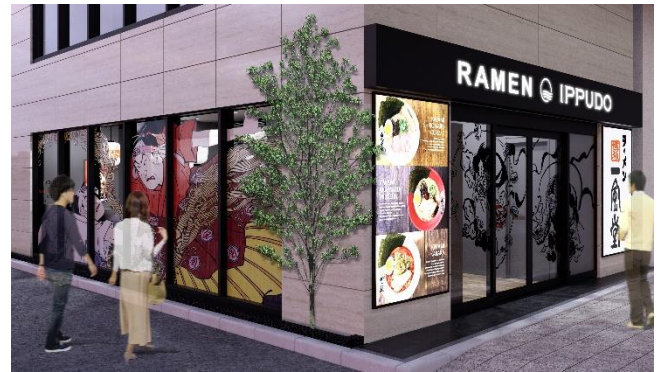
一風堂 浅草雷門通り店 外観イメージ

店名 : 一風堂 浅草雷門通り店 (イップウドウ アサクサカミナリモンドオリテン) 開業日 : 2025年1月31日(金) 住所 : 〒111-0032 東京都台東区浅草 1-6-2 Lang Hotel Asakusa 1 階 営業時間 : 11:00~22:30 (22:00 L.O.) 席数 : 20 席 占有面積 : 51.98 m 2 (15.70 坪) 駐車場 : なし 店舗ページ URL : https://stores.ippudo.com/1155